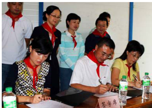
写真左：署名式典、右：生徒たち、下：倒壊前の校舎

新しく建設されるケミン・希望小学校は1,568平方メートルの面積をもち、Qin Chang 村と近隣の5つの村の生徒300人が通えるようになります。社員の寄付と会社からの同額資金を合わせたケミンの寄付金総額は500,000 RMB(約750万円)になりました。寄付金の全額が新しい学校の建設に使用されます。起工式は9月初めに行われ、2009年の初めには完成が予定されています。